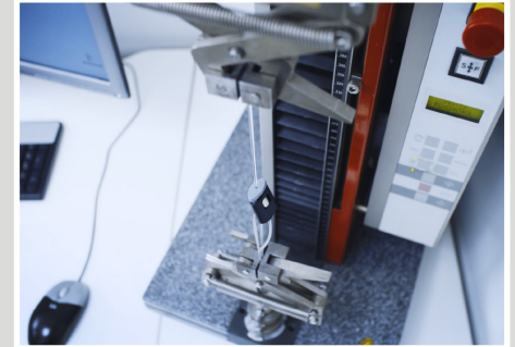
voorbeeld testresultaten Micro Grip