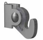
KLEMMHAKEN 20 kg